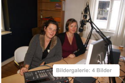
Bildergalerie: 4 Bilder